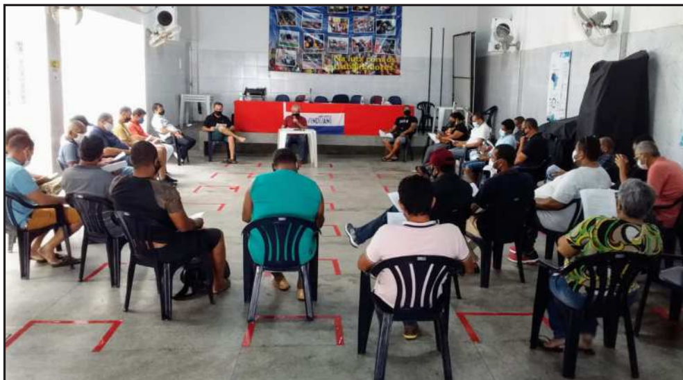
▲ Posse dos representantes sindicais da categoria aconteceu na sede do sindicato