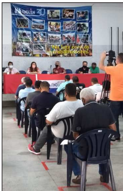
▲ Assembleia aconteceu no auditório do sindicato