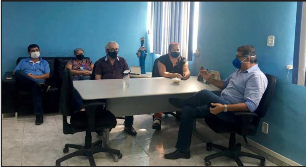
▲ Diretor-presidente da COHIDRO dialogou com a direção do SINDISAN sobre dissídios

Já em relação ao dissídio de 2014, a tramitação continua se arrastando sem uma definição ainda. E o dissídio de 2016 segue aguardando despacho do juiz responsável para que se dê andamento ao julgamento.