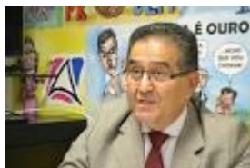
Abelardo Oliveira – Engenheiro, ex-secretário Nacional de Saneamento e ex-presidente da Embasa – Bahia.